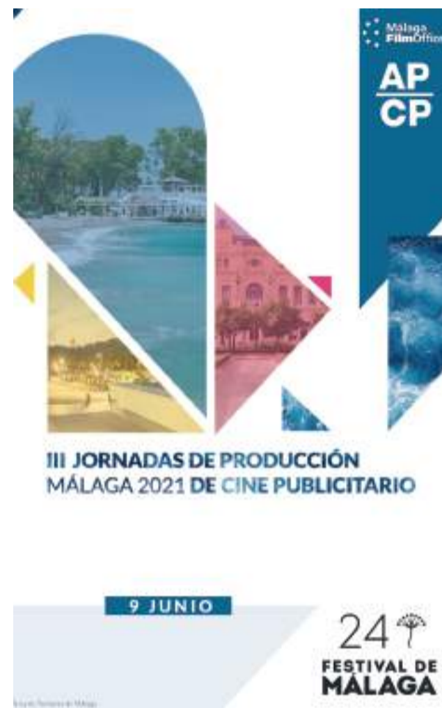
Imagen promocional de las III Jornadas de Producción de Cine Publicitario.