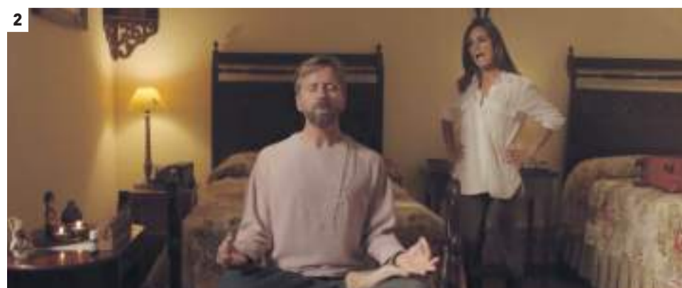
1. El año de las 7 películas. 2. El mundo es suyo 2.