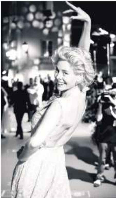
Exposición Calle Larios. Cine de Cerca.