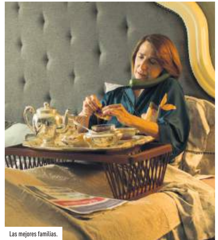
Las mejores familias.

29:00 RECTORADO DE LA UMA. El mundo es suyo 2.