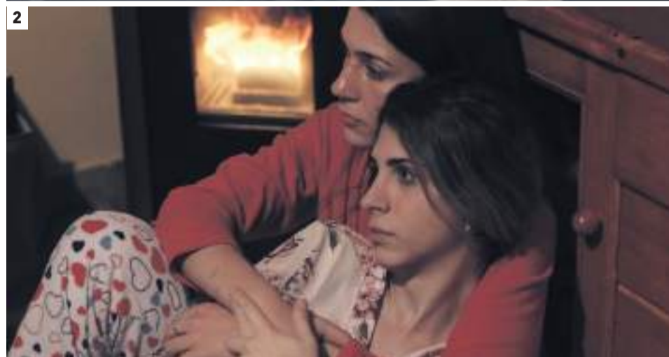
1. Retiros (in) voluntarios (VOSE). 2. Sedimentos.