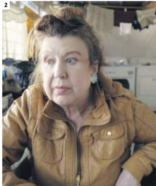
1. #Precaritystory (VOSE). 2. Entre ellas (VOSE).

un ejemplo de la creciente precarización del trabajo, al tiempo que expone una realidad poco conocida del ambiente académico británico. Filmado durante las huelgas del personal universitario del Reino Unido entre 2018 y 2020, este documental quiere contribuir al debate sobre los efectos de las políticas neoliberales y, ahora también, de la pandemia.