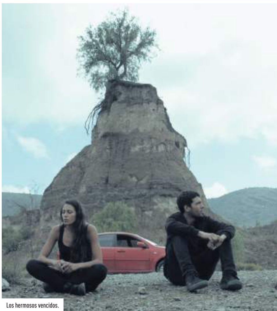
Los hermosos vencidos.