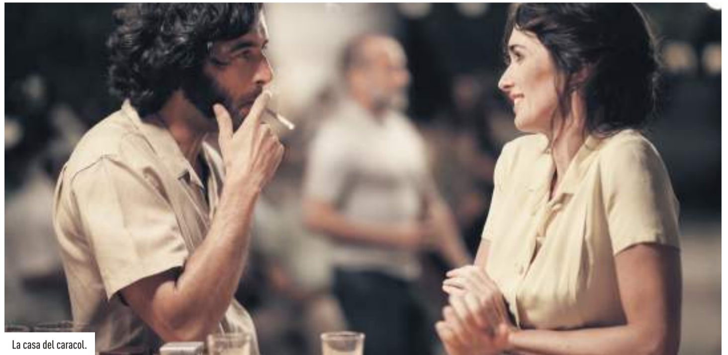
La casa del caracol.