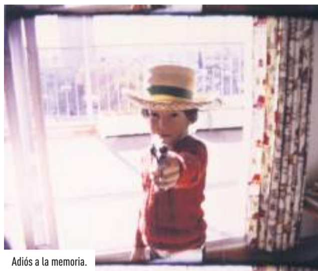
Adiós a la memoria.

"Nadie puede elegir olvidar, nadie tiene esa fortuna, pero