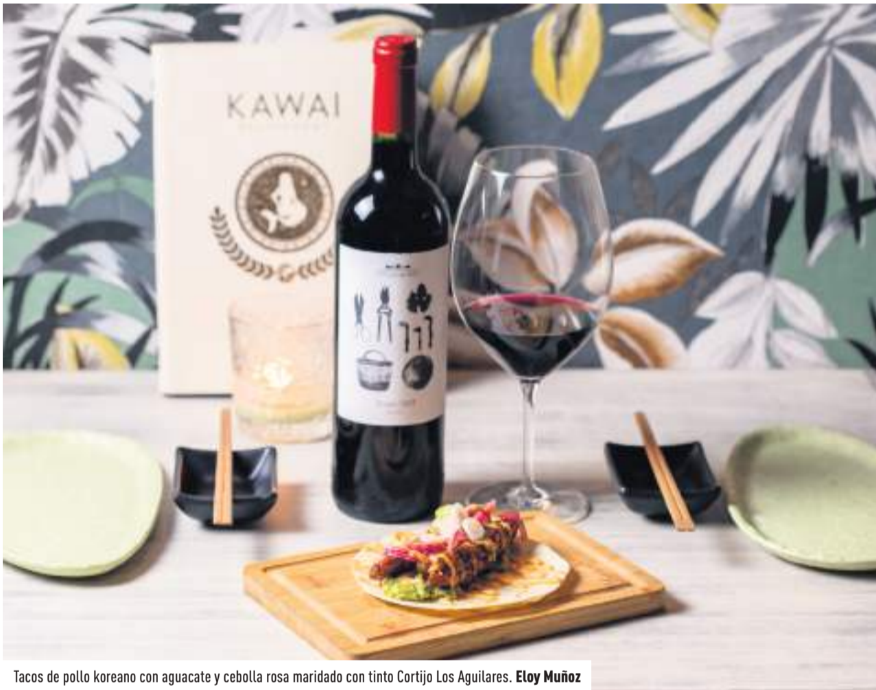
Tacos de pollo coreano con aguacate y cebolla rosa maridado con tinto Cortijo Los Aguilares. Eloy Muñoz