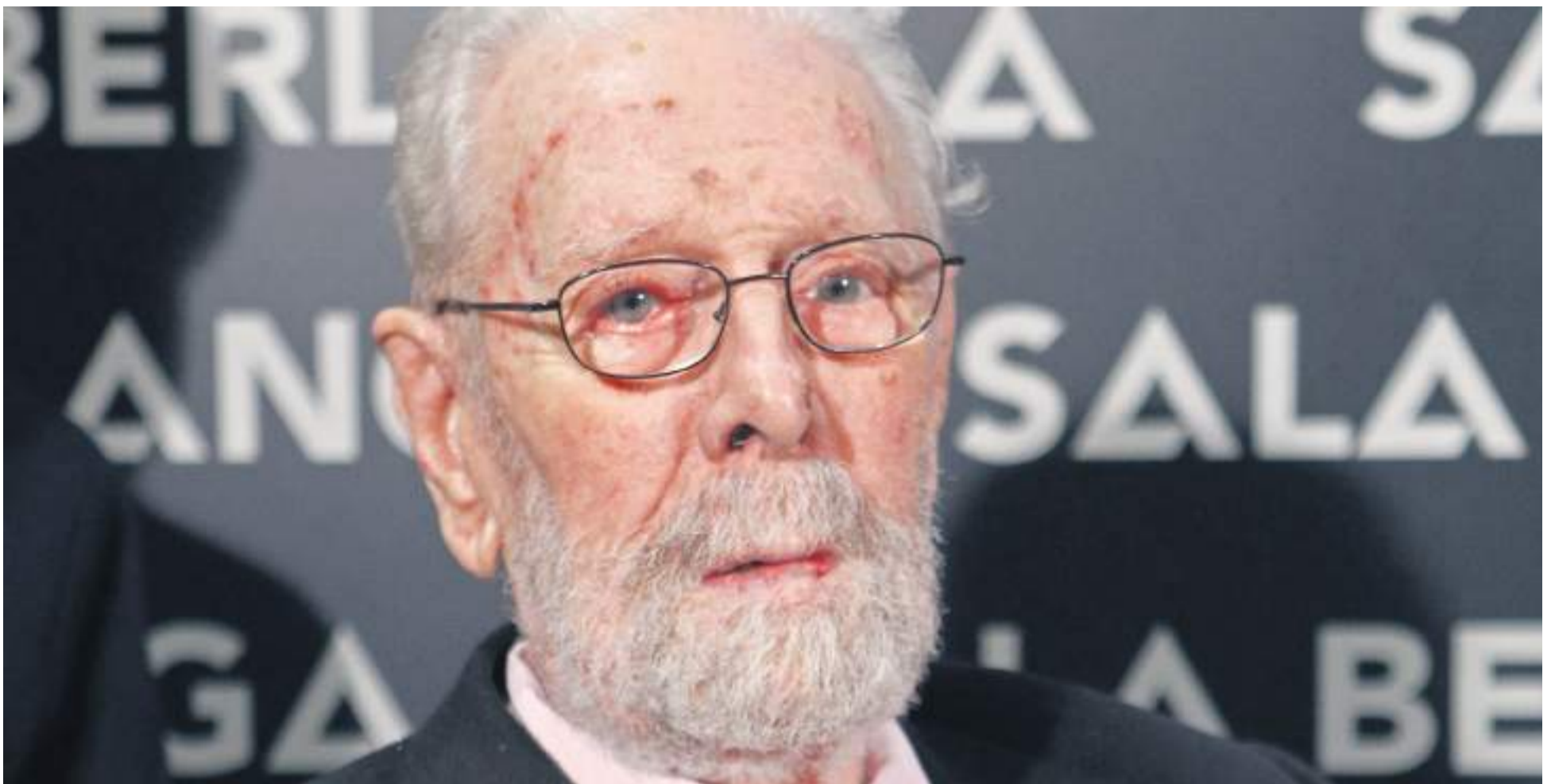
Luis García Berlanga.