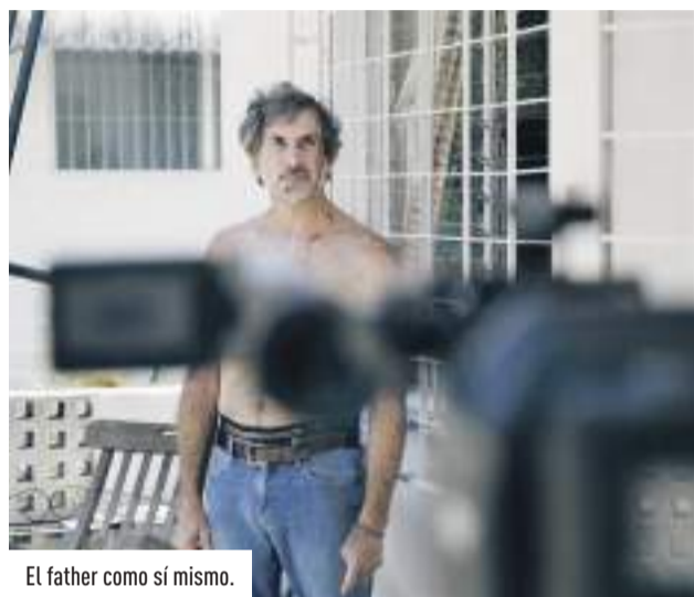
El father como sí mismo.

bre la historia argentina que llevó a la última dictadura, se entera de que su padre padece Alzheimer. Siente entonces que esa ironía del destino le obliga a completar esas películas con una