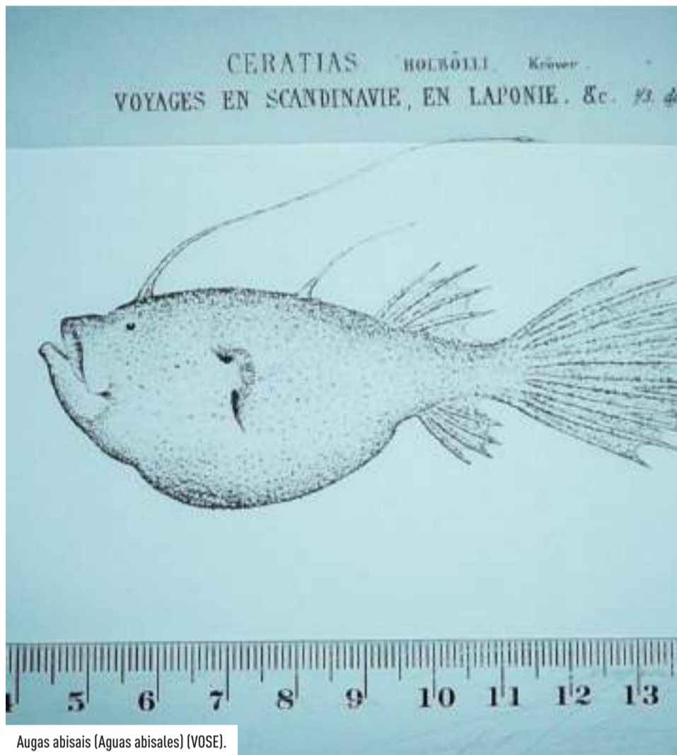
Augas abisais (Aguas abisales) (VOSE).