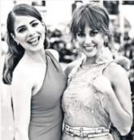
Exposiciones Calle Larios. Cine de Cerca.