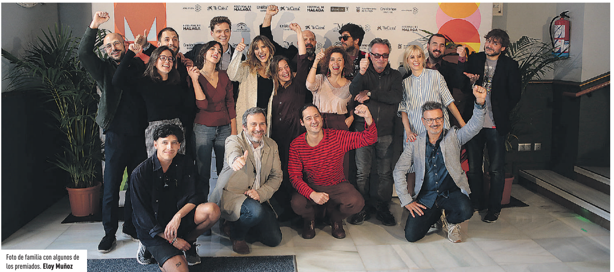
Foto de familia con algunos de los premiados.