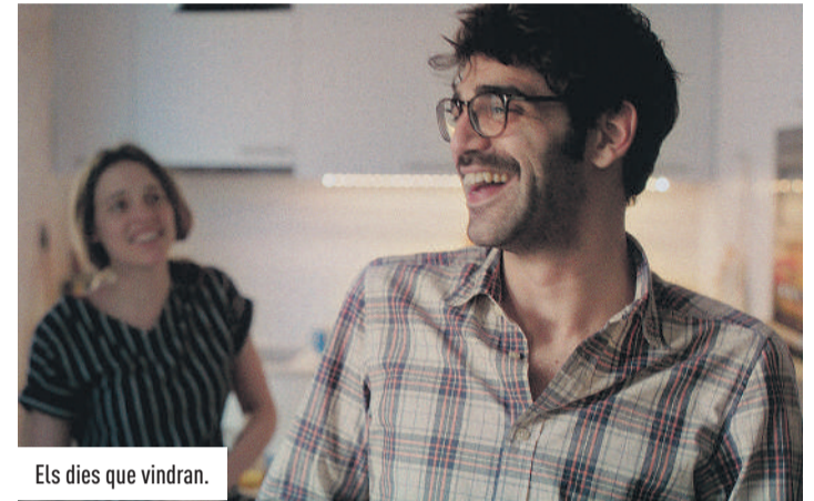
Els dies que vindran.