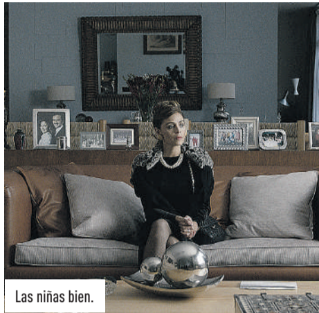
Las niñas bien.