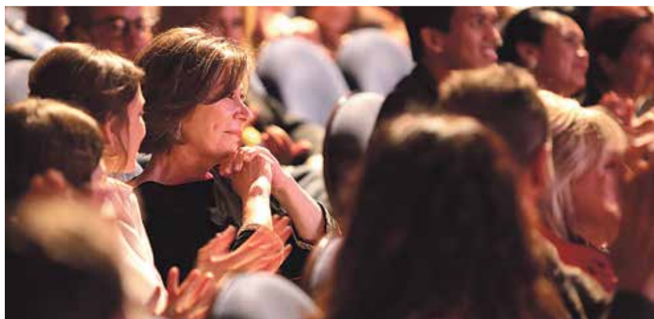
La homenajeada escucha emocionada las palabras de los amigos que la acompañaron anoche.

Y así, a su callada manera, con emoción contenida y una elegancia innata, la artista estrechó el premio entre sus manos acercándose al pecho, como si en ese momento se aprobara esa asignatura pendiente que la ciudad tenía con la actriz. La Biznaga la aceptó con serenidad y mesura, aludiendo a que los premios siempre le habían parecido una exageración. Pero con este estaba dispuesta a hacer una excepción. "Me lo quedo para mí sola, no lo comparto. Haber resistido bien merece la Biznaga", sentenció. Efectivamente. Ya no le hacen falta reválidas. Ha aprobado en marzo. Se gradúa cum Laude en el Festival de Málaga Fiorella Faltoyano.