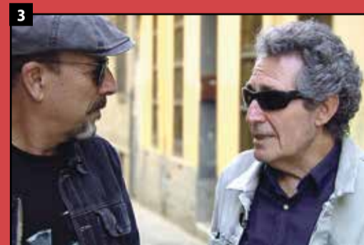
1 Cantábrico. Los dominios del oso pardo. 2 Money Puzzles (VOSE). 3 Ruibal, por libre.