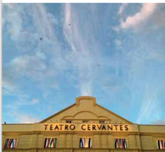
antonio_conde_ Los cielos del Festival de Cine de Málaga #malagaescine #18festivalmalaga @festivalmalaga #gentede-cine @elpimpimalaga