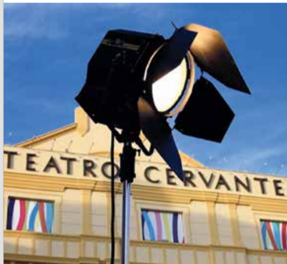
fcomm2 Málaga es luz #malagaescine #18festivalmalaga @festivalmalaga #MálagaEsCine