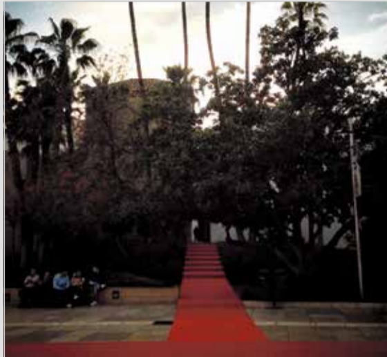
eduvqnk #18festivalmalaga #malagaescine #MálagaEsCine

Festival de Málaga @festivalmalaga En #18festivalmalaga tenemos un fantástico jurado de Escuelas de Cine, muchas gracias a todos ellos! @samirmechbal